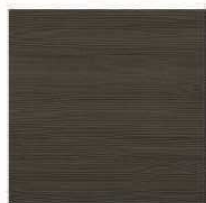
Larice grigio lucido