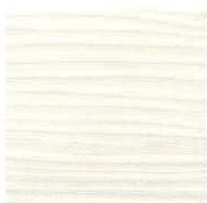
Larice bianco lucido